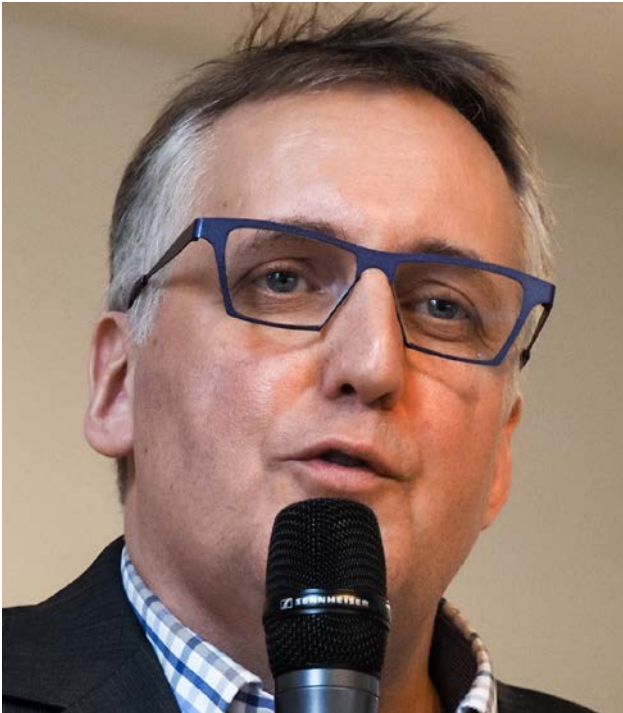
Achim Beule, Referent für Bildung für nachhaltige Entwicklung, Ministerium für Kultus, Jugend und Sport